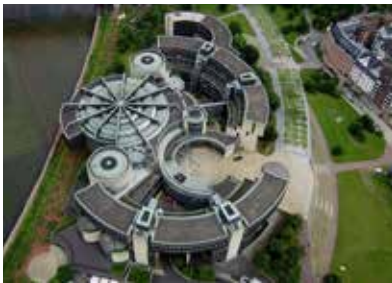
Landtag des Landes NRW, Düsseldorf Verfassung des Landes NRW