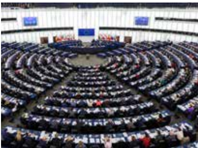
Plenarsaal des EU-Parlaments, Straßburg Europäische Union (EU)