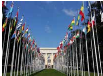
Gebäude der Vereinten Nationen, Genf Vereinte Nationen (UNO)