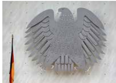
Stirnseite des Plenarsaals, Bundestag Berlin Grundgesetz