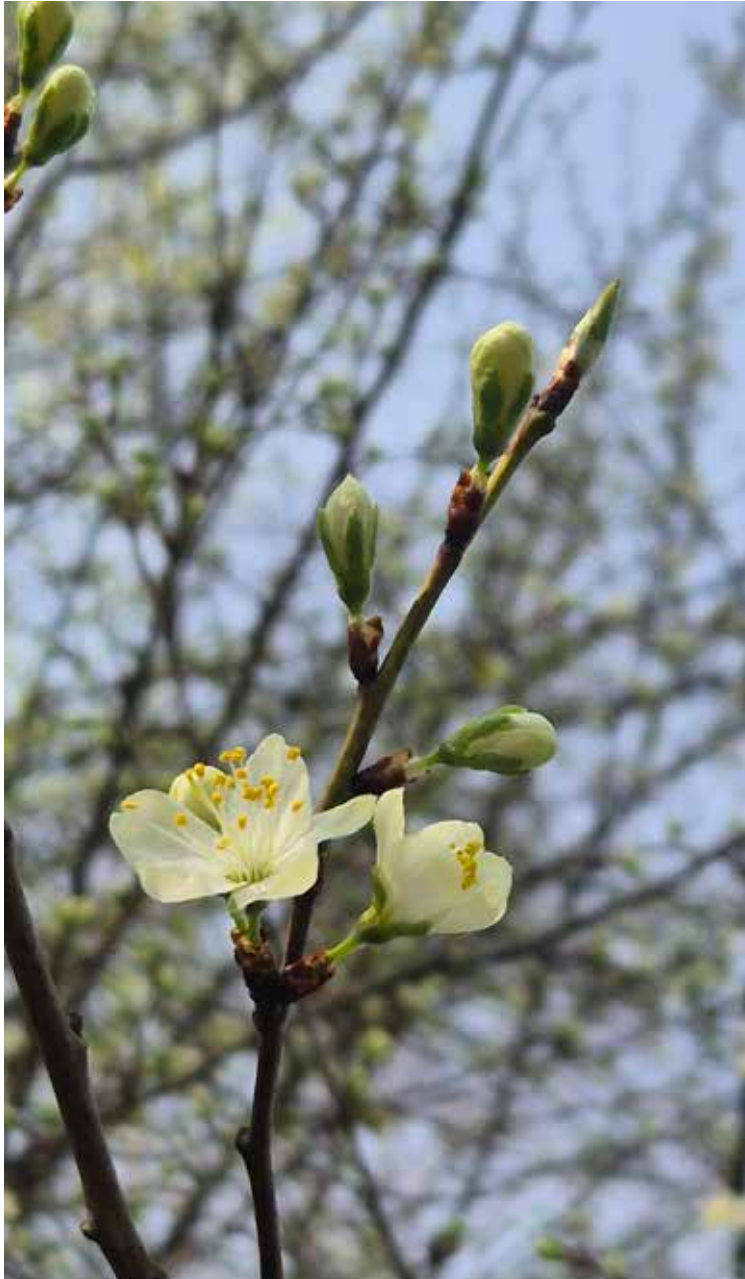
Katholische Kirche Derendorf Pempelfort