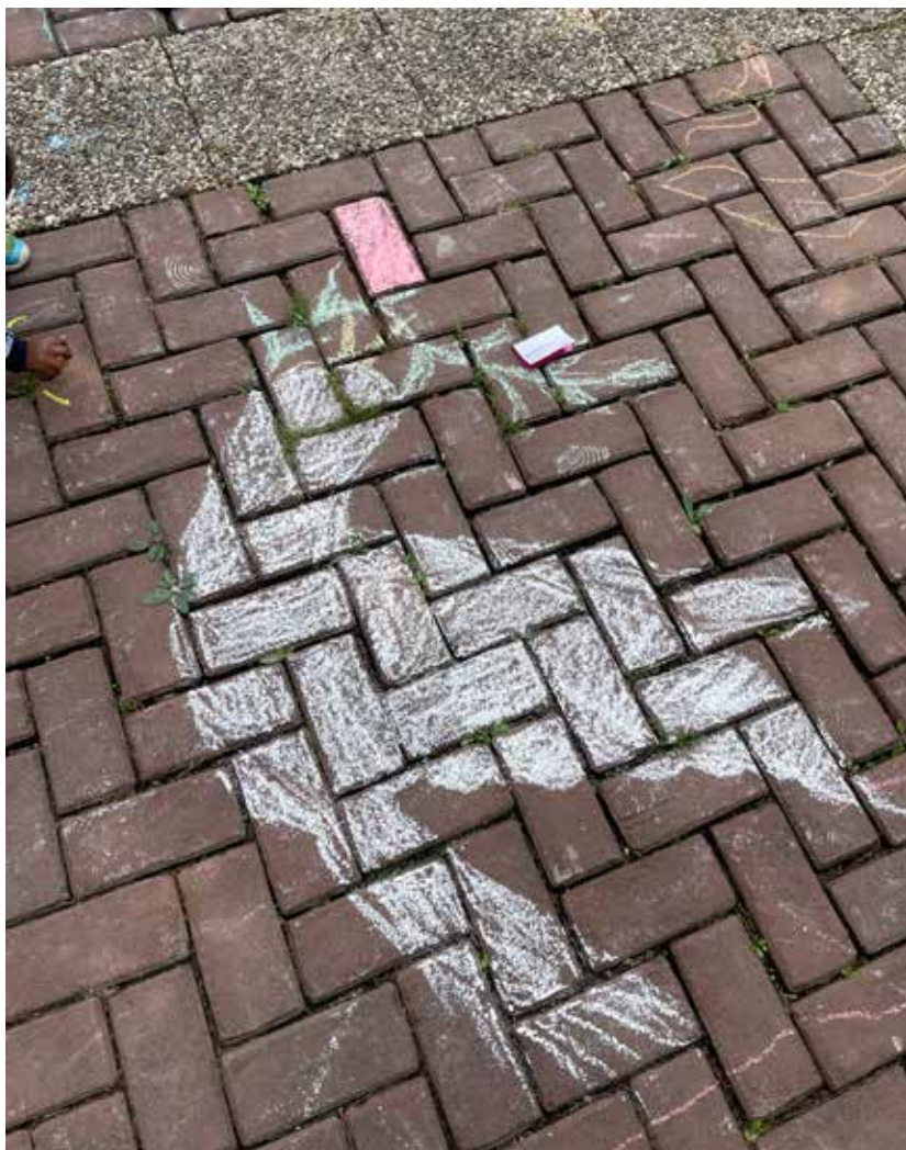
Katholische Kirche Derendorf Pempelfort