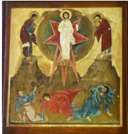
Ikone aus der Ikonostase in der Kirche Heilig Geist

Schon in den ersten Jahren der Christenheit hatten sich unterschiedliche Termine für das Osterfest entwickelt. Einige hatten den Tag des Passahmahles, andere den Termin des 14. Tags des ersten (jüdischen) Monats gewählt (vgl. Lev 23,5; Num 28,16; Jos 5,11). Erst auf Druck von Kaiser Konstantin ging man auf dem Nicänischen Konzil die Streitfrage an. Auch wenn der Wortlaut eines Beschlusses nicht mehr erhalten ist, lässt sich aus einem Schreiben des Kaisers schließen, dass die Konzilsväter einen gemeinsamen Ostertermin einforderten und Bischof Athanasios von Alexandria auftrug, einen Termin zu bestimmen, wobei „Os-