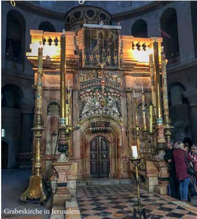
Grabeskirche in Jerusalem

Das Grab ist leer, der Held erwacht, der Heiland ist erstanden! Da sieht man seiner Gottheit Macht, sie macht den Tod zuschanden. Ihm kann kein Siegel, Grab noch Stein, kein Felsen widerstehn; schließt ihn der Unglaub selber ein, er wird ihn siegreich sehn. Halleluja!