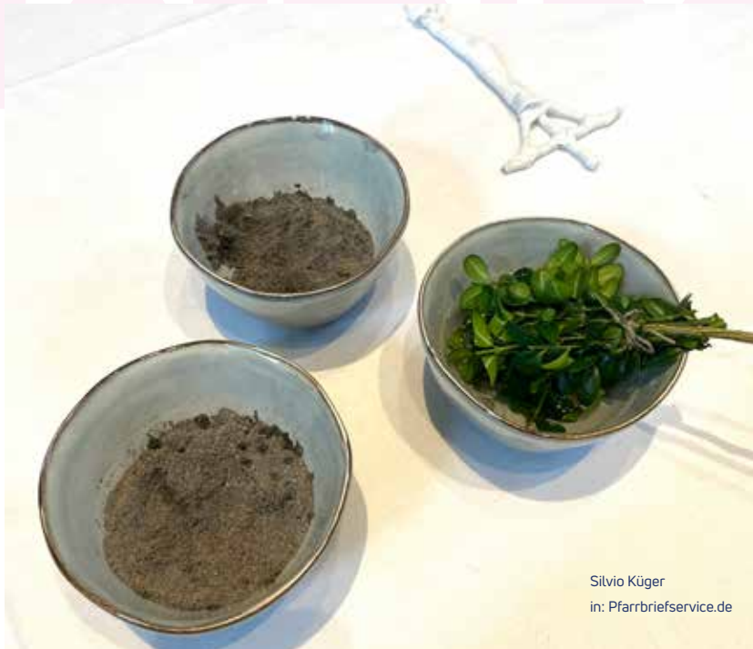
Silvio Kuger in: Pfarrbriefservice.de