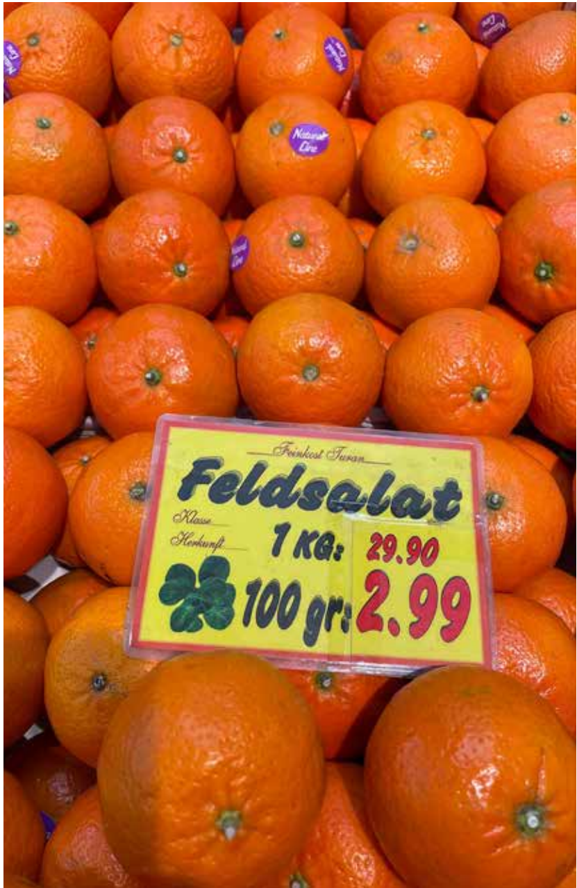
Katholische Kirche Derendorf Pempelfort