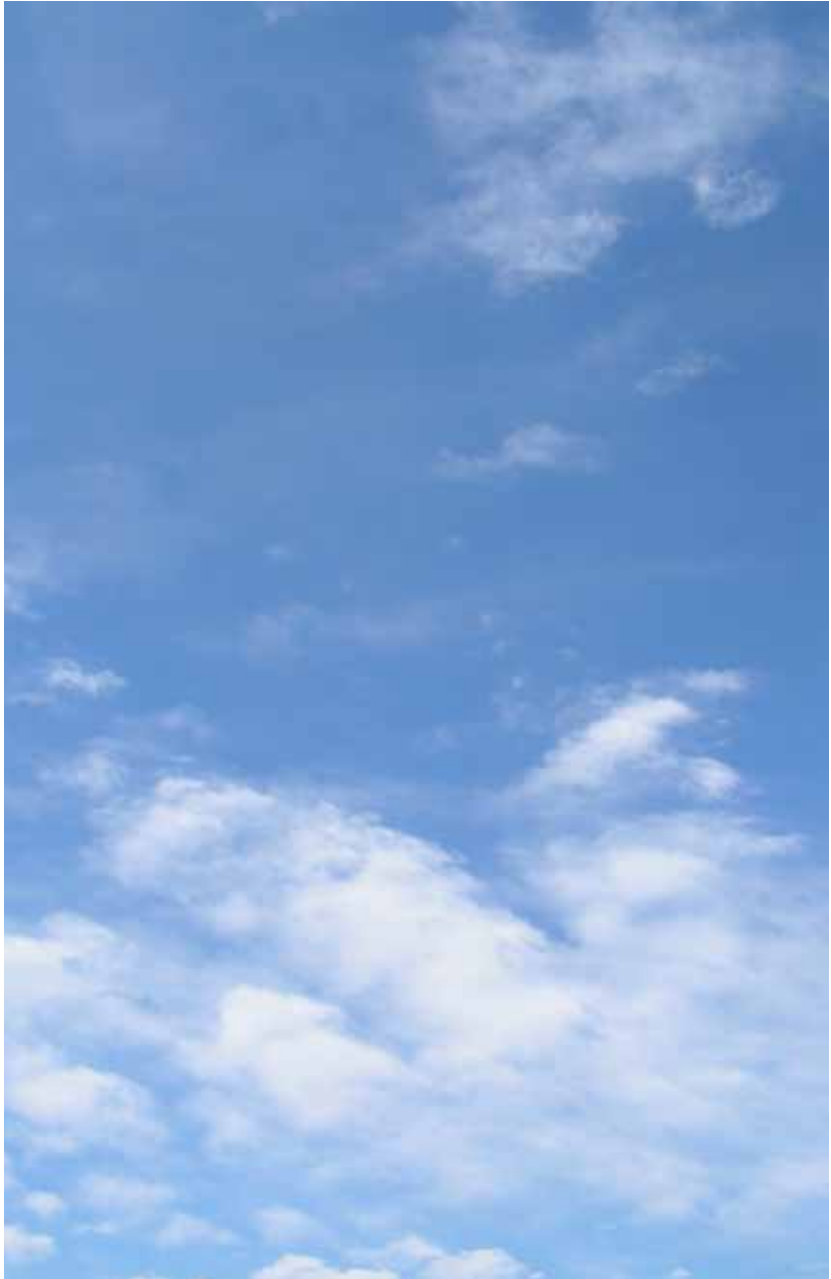
Katholische Kirche Derendorf Pempelfort