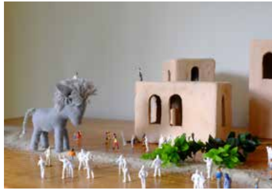
aus dem Film zu Palmsonntag: Einzug Jesu in Jerusalem

2017 haben Philippa Gerling, Ulrike Krippendorf und Eva Koch kurze Filme zu den Texten für die digitale Veröffentlichung erstellt. Sie wählten bewusst einen digitalen Weg,